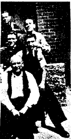
◀ 137. El exilio. Juan Peiró, acompañado de sus hijos, poco antes de ser entregado por las autoridades francesas a la policía franquista.