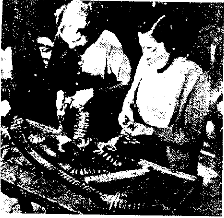
▲ 126. Esfuerzo de guerra. Barcelona. Taller de automóviles convertido en fábrica de bombas.