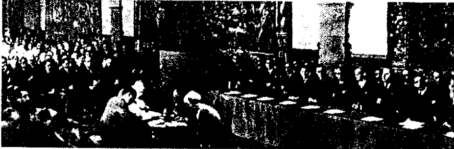
▲ 136. Febrero de 1939. Las Cortes de la República se reúnen en el refectorio del Monasterio de Montserrat.