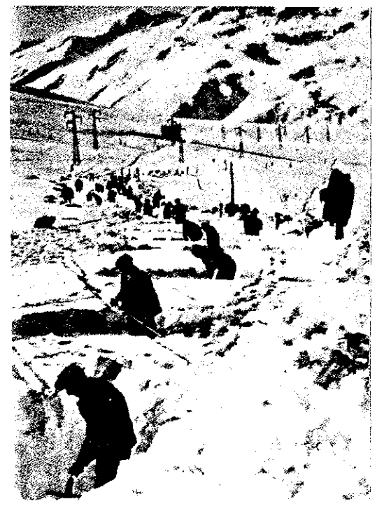
135. Enero de 1939. Barcelona se prepara (inútilmente) para resistir el asalto del ejército fascista.