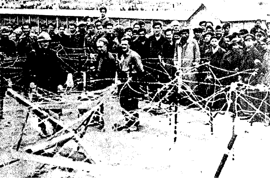
▼ 138. El exilio. Campo de concentración francés para los combatientes del Ejército popular español.