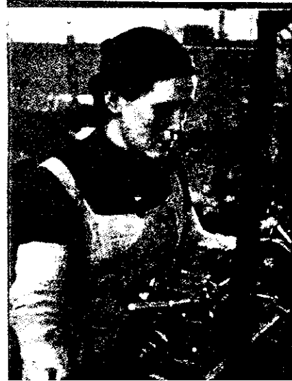
133. Esfuerzo de guerra. De un prospecto de Mujeres Libres.

Cada mujer, una combatiente en retaguardia. La guerra exige el esfuerzo de todas. Ni una mujer debe estar inactiva en estos momentos decisivos. En MUJERES LIBRES encontraréis nuestro punto de lucha. ¡Mujeres! ¡Vuestro esfuerzo puede decidir la victoria!