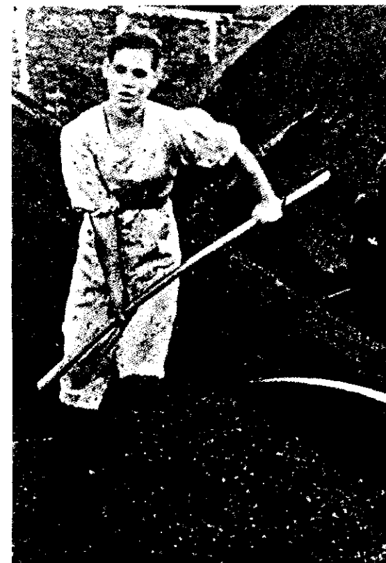
► 125. Esfuerzo de guerra. Mujeres paleando carbón.