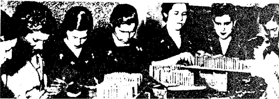
▼ 130-131. Esfuerzo de guerra. Participación de los no aptos para el frente.