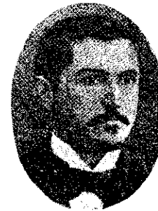
Juan B. Justo