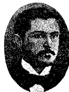
Juan B. Justo