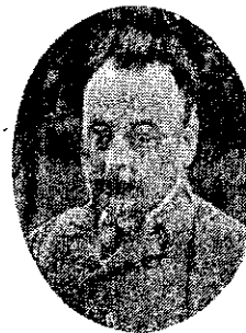
Roberto J. Payró