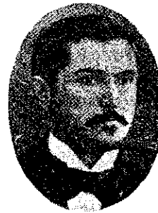
Juan B. Justo