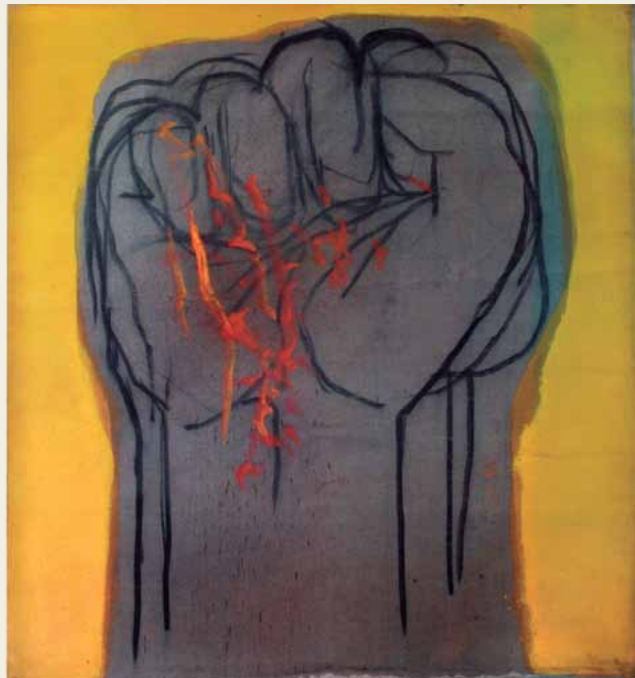
José Balmes, El Pueblo Vencerá, 1972